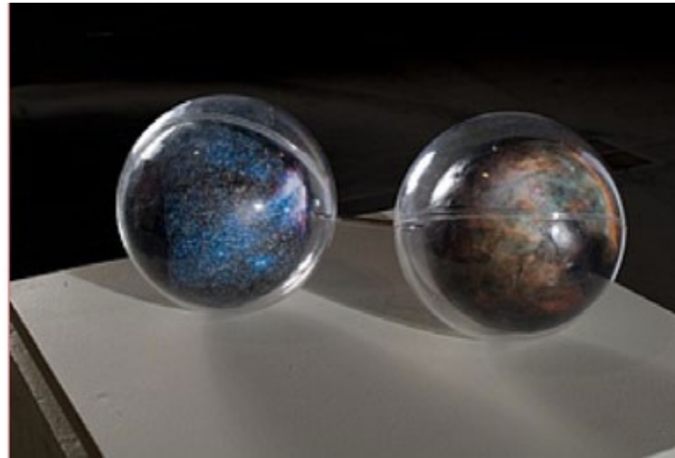
Exposition « Anatomie des territoires » Basserode, « Les Haltères de l'espace », 2005