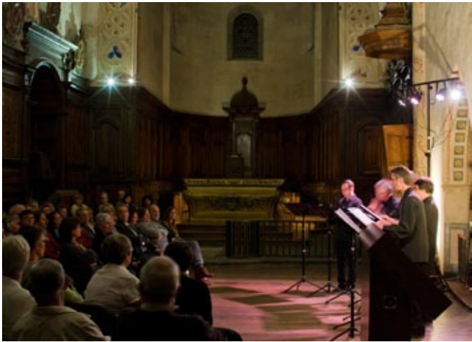
Concert de Scandicus