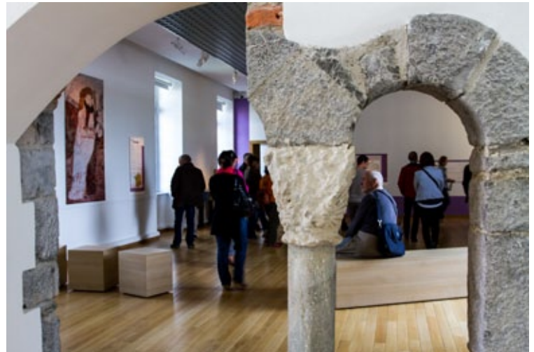
Le musée départemental