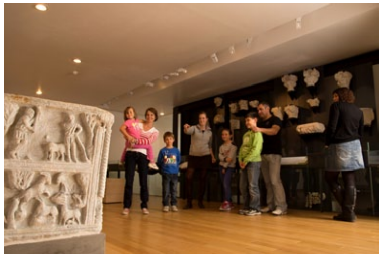
Le musée départemental