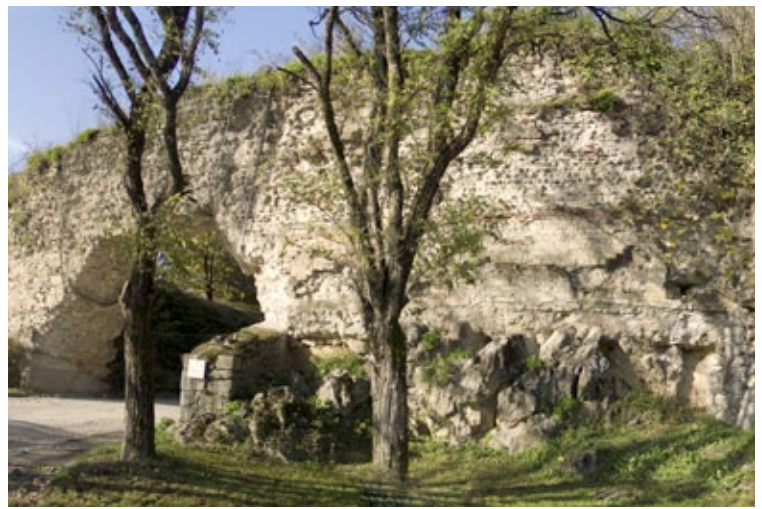
Le rempart gallo-romain