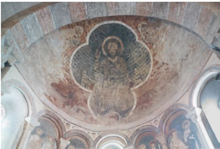
La cathédrale Saint-Lizier