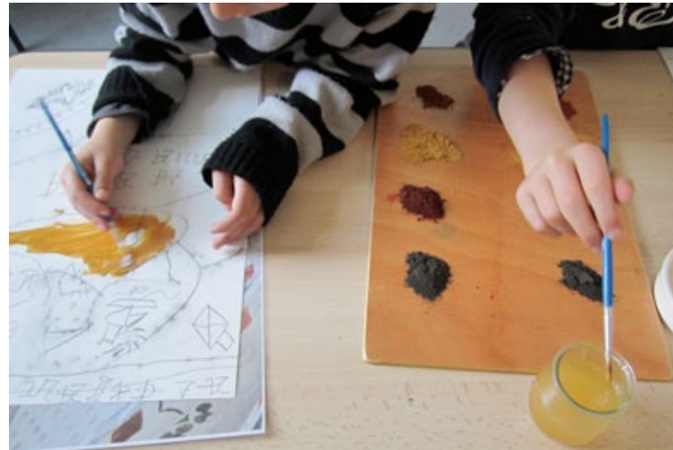
Animation « Les Petits Curieux »