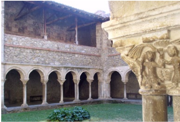
Le cloître roman