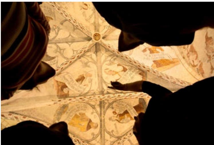
Les peintures de Notre-Dame-de-la-Sède