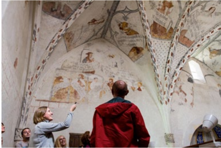
Les peintures de Notre-Dame-de-la-Sède