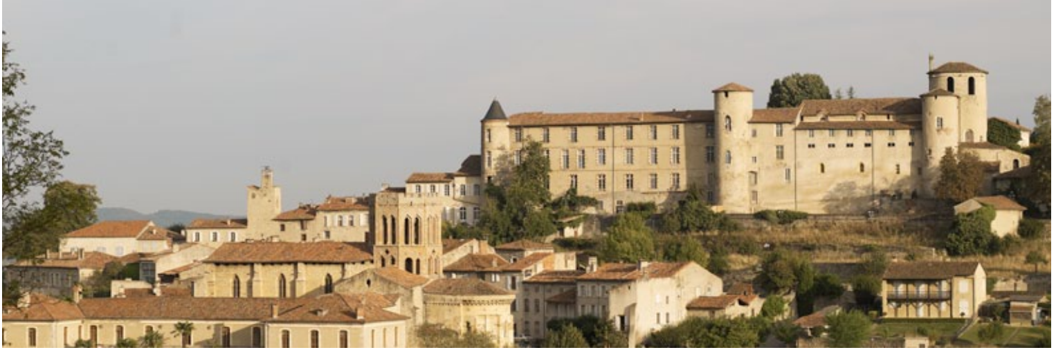
Vue de la Cité