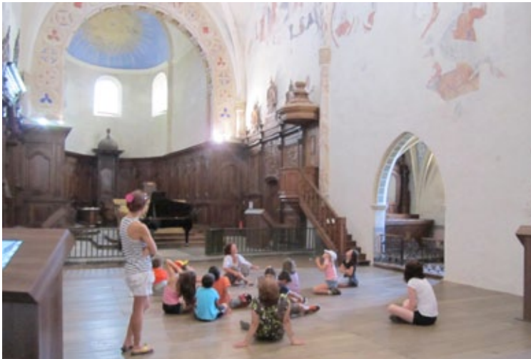
Animation « Les Petits Curieux »