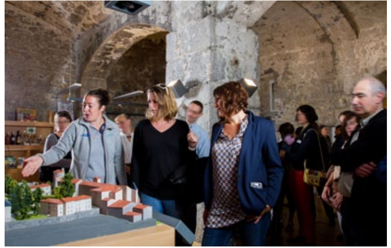
« Les écuries » du Palais des Évêques