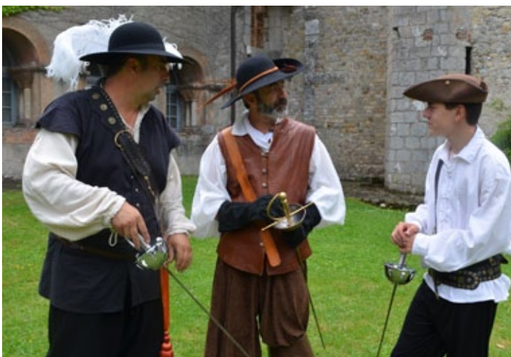
Les Lames d'Ariège