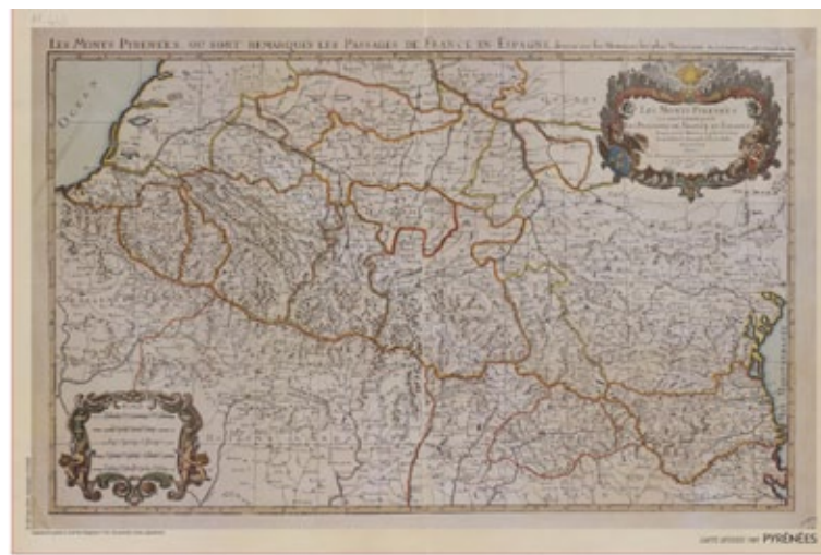
Exposition « Anatomie des territoires » Les Monts Pyrénées, passages entre la France et l'Espagne, copie de la carte de 1691