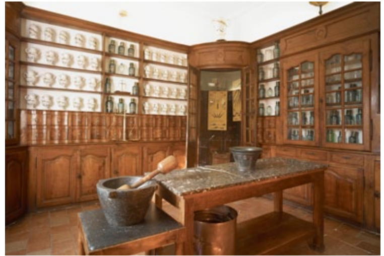
La pharmacie de l'Hôtel-Dieu