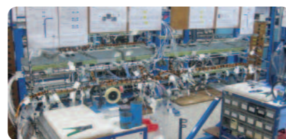
> Poste de travail 800 VU en Tunisie > 800 VU workstation in Tunisia

La forte implication du personnel a déjà contribué au succès de ces projets : amélioration des conditions de travail, réduction d'encours de production et des cycles, amélioration de la productivité, ajustement de standards (procédures de travail, marquage, affichage, gestion de projet...).