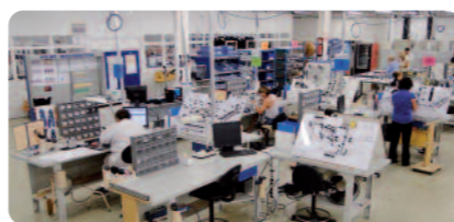
> Ligne de fabrication du 80 VU d'ATR au Crès > ATR 80 VU production line in Le Crès