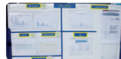
> Exemple de tableau de communication > Example of a notice board