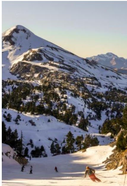
La Pierre Saint Martin

Toutes les informations des stations N'PY et webcam sur www.n-py.com